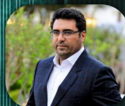
دکتر مجید کرباسچی

حقوقدان، منتور و مشاور مستقل آژانسهای تخصصی سازمان ملل